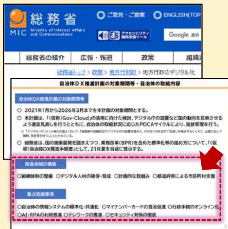
出典「自治体DX推進計画概要」p3より